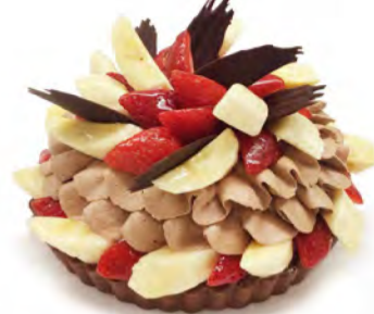
④ いちごとバナナのチョコケーキ [ベース:ビターチョコレート]