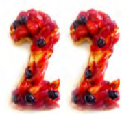
「夫婦の日」が 結婚記念日