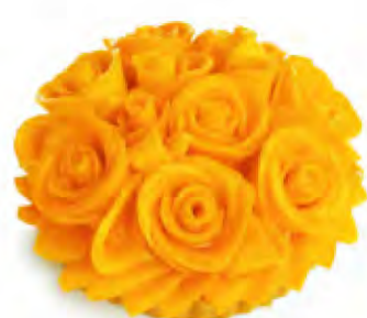
① マンゴーローズ [ベース:フロマージュブラン]