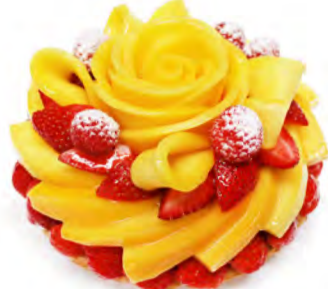
③ いちごとマンゴーのケーキ [ベース:カスタードクリーム]