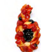
出会って6ヶ月 二人の記念日