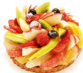
② 季節のフルーツケーキ [ベース:カスタードクリーム]